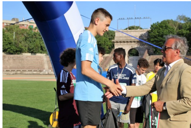
Immagine published on 12 maggio 2022 | Leave a response