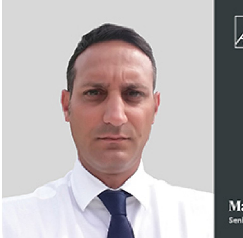
Il nuovo servizio di AXA XL per la mitigazione dei rischi ambientali

BANOR SIM PRESENTA LA QUARTA RICERCA ESG IN COLLABORAZIONE CON IL POLITECNICO DI MILANO